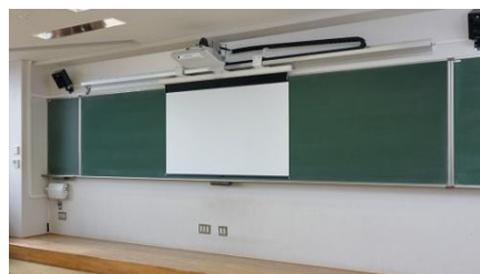
※写真はスライドタイプ（オプション）です。